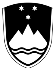
Črno-beli grb (varianta 2)